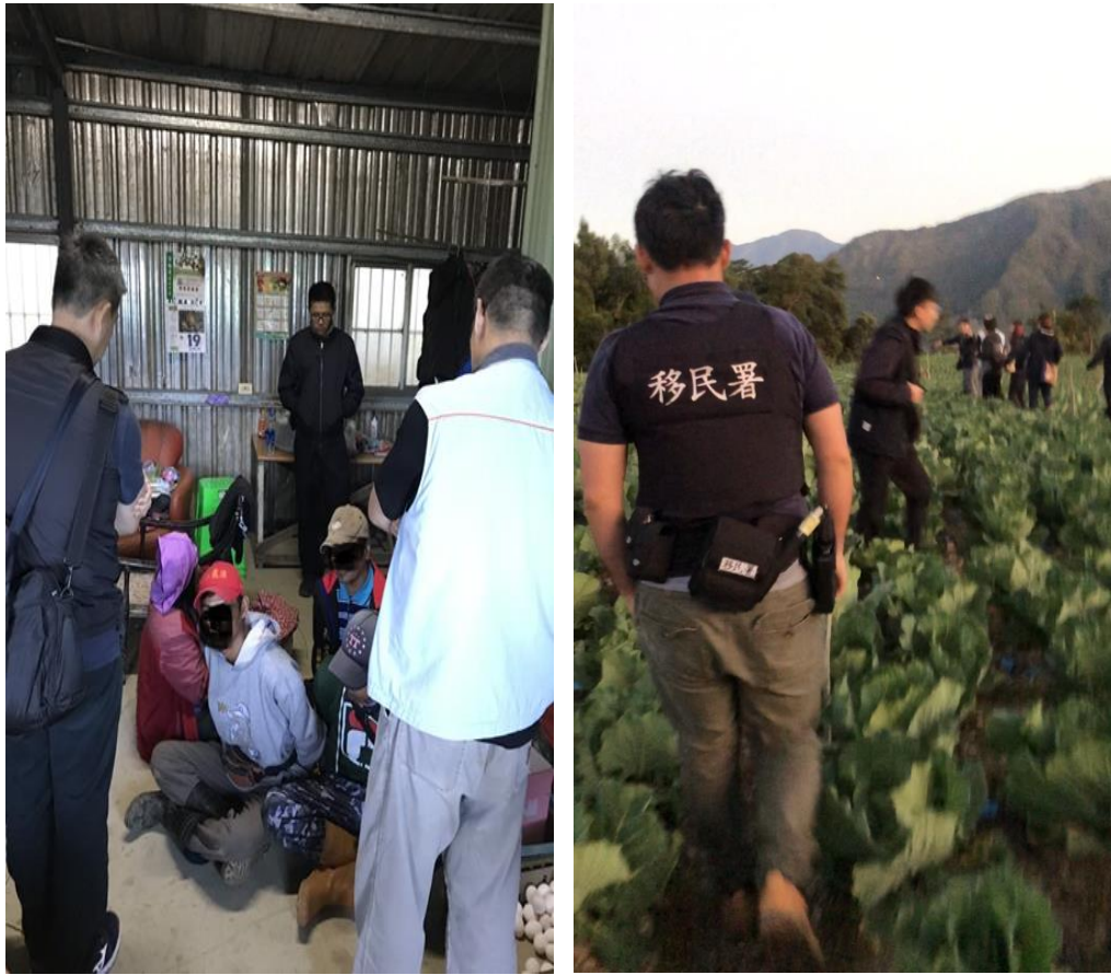
移民署人員至南投山區查緝勞力剝削集團並逮捕嫌疑人