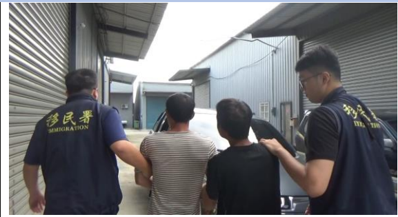
拘提涉案國人到案