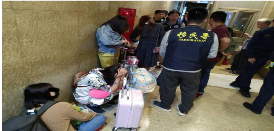
移民署與臺北市政府警察局聯手破獲性剝削集團

取不法暴利；以每日可賺進萬元以上及預先支借機票費、食宿費為詐騙話術，誘騙渠等女子來臺，遂即安排居住於臺北市「鑽○大樓」社區內，以站街拉客之方式，使女子開始從事性交易之工作。全案於2019年10月將國人胡嫌等21名犯嫌，依涉嫌違反人口販運防制法及刑法妨害風化等罪移送臺灣臺北地方檢察署偵辦中。