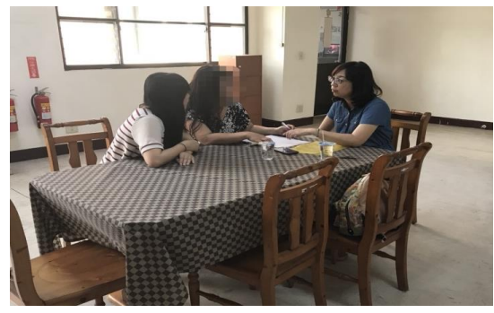
法律服務：法扶律師到所進行法律諮詢服務，依需求協助申請及連結法律補助