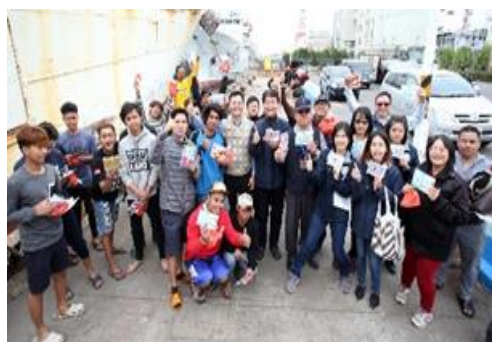
前鎮漁港分贈暖暖包、盥洗用品及二手衣物外籍漁工寒冬送暖活動