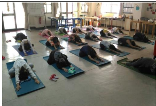
紓壓瑜珈：規畫非語言的紓壓系列課程，陪伴被害人一同體驗及放鬆。