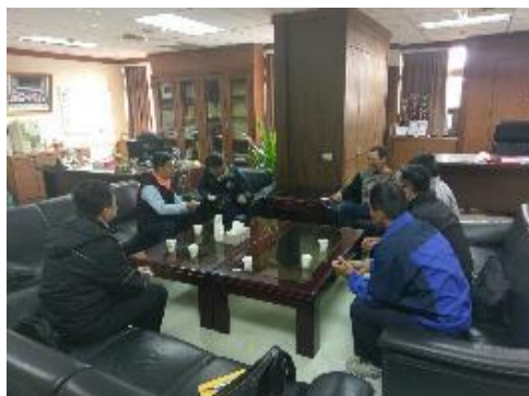
聯合拜訪東港區漁會