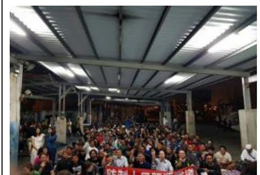
「防制人口販運政策宣導暨關懷漁工座談會」