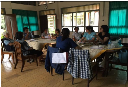
返鄉服務：透過實地拜訪被害人母國政府及民間團體，了解資源、服務及合作方式，為返家被害人提供暫時安全住所、工作機會，並協助在地適應與重建(印尼、泰國)。