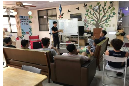
中文教學：簡易中文教學及互動，提升被害人在臺工作及生活自理能力。