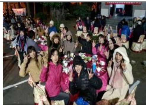
結合社區大學宣導