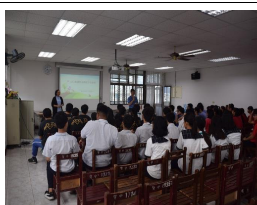
台東寶桑國中校園宣導活動