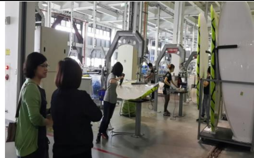
就業媒合：拜訪鄰近廠商，開拓被害人就業機會，穩定就業與經濟收入。