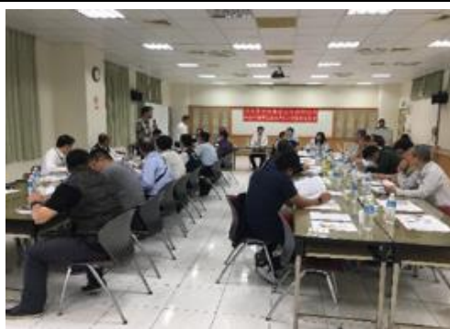
「106 年度船務代理暨航商及漁業公會業務座談會」