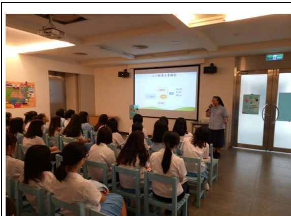
台北崇光女中校園宣導活動