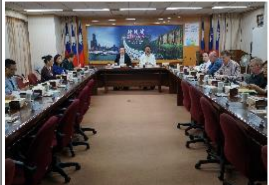
邀集駐華機構及團體座談