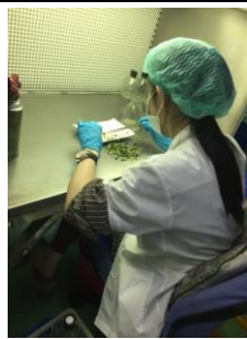
就業訪視：透過不定期至被害人工作地訪視，了解工作情形，俾利進一步合作。