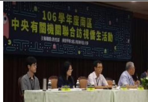
參加「學年度南區中央機關聯合訪視僑生活動」座談講座