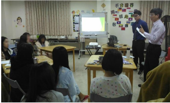
專家講座：依被害人所需，研擬專家講座主題，以提升被害人相關知識及預防能力。