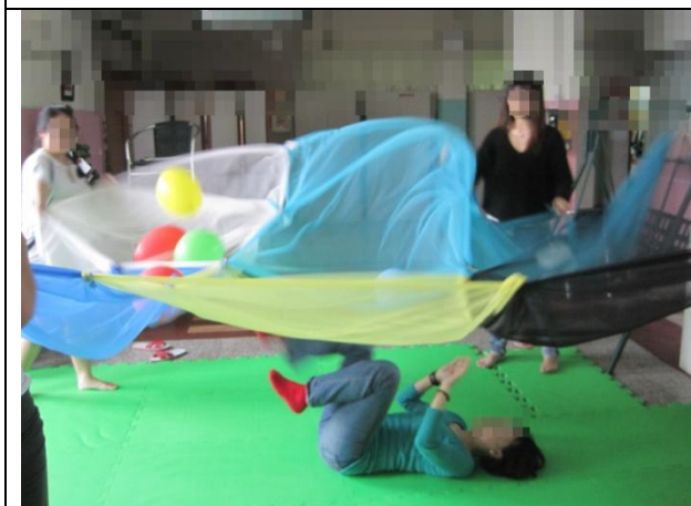
表達性藝術治療-透過舞蹈、律動，導入覺 察、互動及溝通