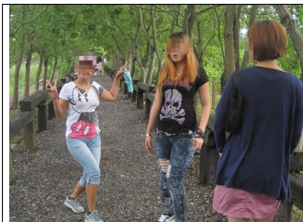
休閒娛樂活動-戶外踏青、主題觀光、文化 休閒