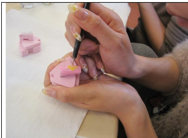
指甲彩繪技能學習課程

此外，2013 年度協助 1 名無法返國被害人取得居留證、長期居住臺灣，已完成職業訓練、銀行開戶、汽機車駕照考取，並規劃完成國民教育及丙級證照考取。