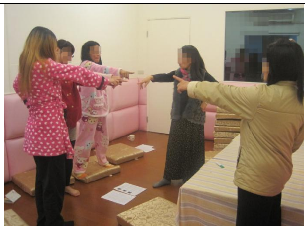
生命探索教育-體驗、生活經驗整理、分享 與價值重塑