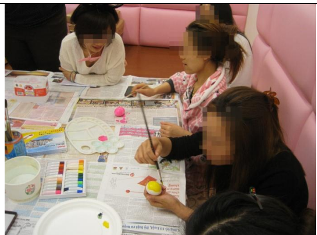
多元文化活動-認識復活節與彩蛋繪製、尋 找彩蛋遊戲