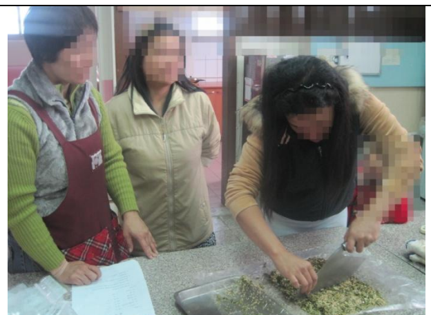
手工網拍烘焙技能學習課程-年節手工南瓜子酥、花生酥、南棗酥、牛軋糖