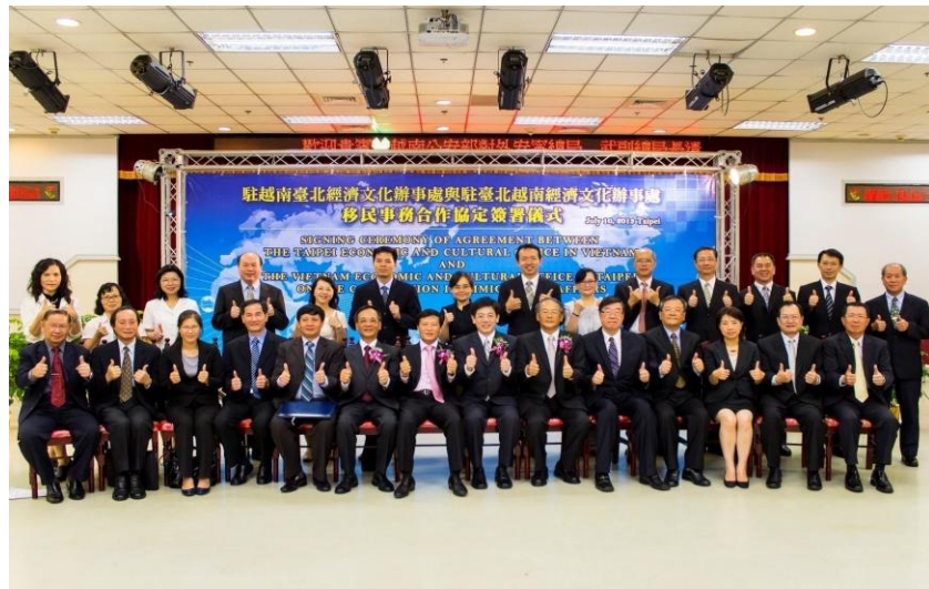
我國與越南於 2013 年 7 月 10 日上午 10 時在臺北簽署「移民事務合作協定」