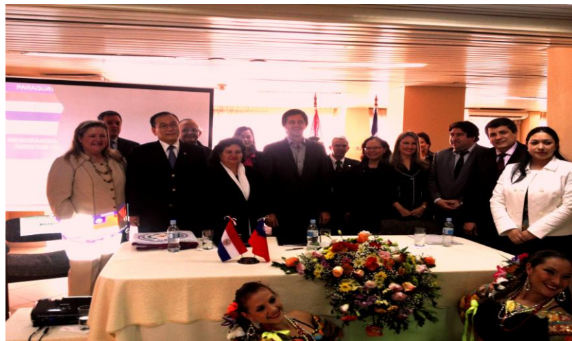
我國與巴拉圭共和國於 2013 年 6 月 24 日以換文方式簽署「移民事務與防制人口販運合作瞭解備忘錄」