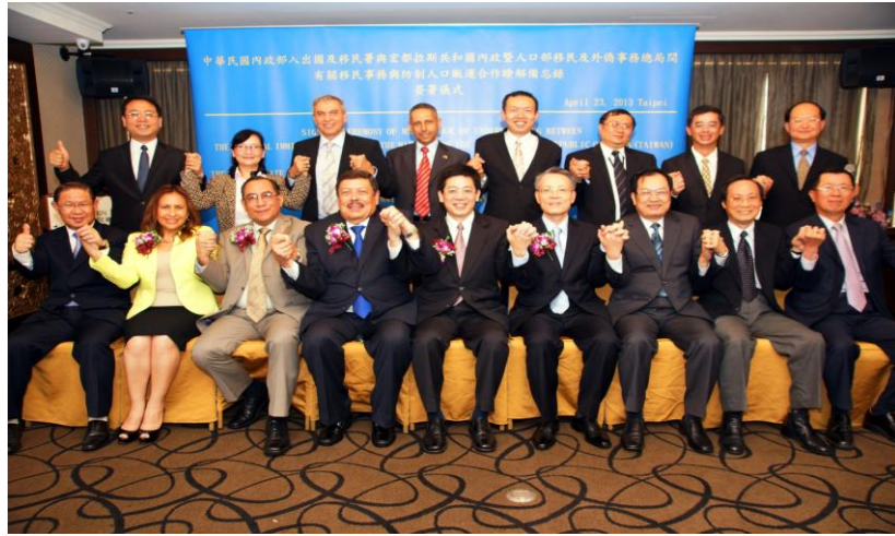
我國與宏都拉斯共和國於 2013 年 4 月 23 日下午 3 時 30 分在臺北簽署兩國「移民事務與防制人口販運合作瞭解備忘錄」